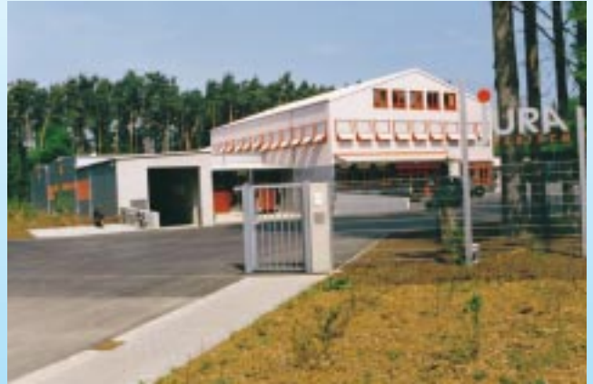
Binäreis kühlt „Jura-Fleisch“ 462

Auf dem Güntner-Symposium wurde die Wirtschaftlichkeit von hybriden Trockenkühlern anschaulich dargestellt