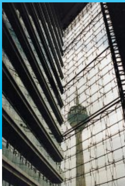
Teilansicht von Deutschlands modernstem Energiesparhaus