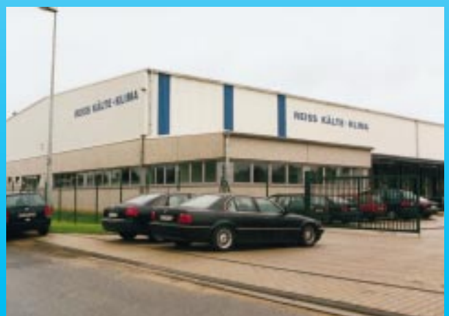
REISS Kälte-Klima jetzt in Köln-Wesseling