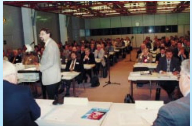
ATP-Fachveranstaltung 1998 am 17. November in München