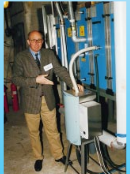
Nordmann macht Dampf