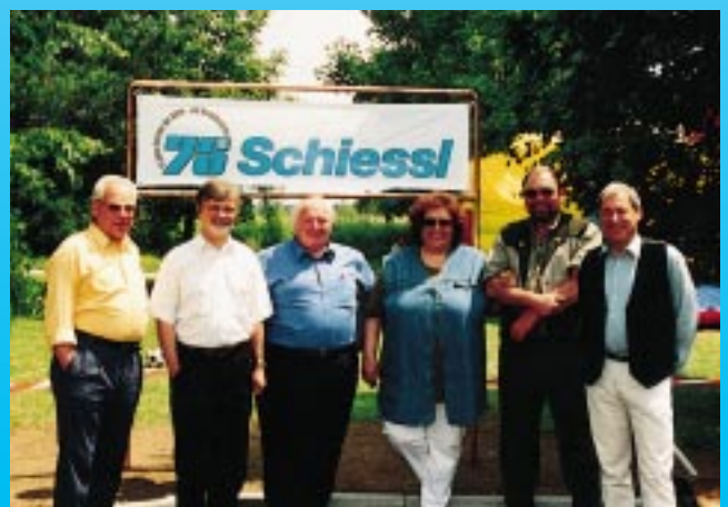
Schiessl feiert sein 75jähriges Bestehen