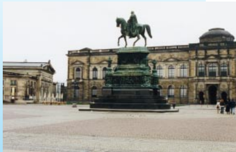
Luftbefeuchtung in der Sempergalerie