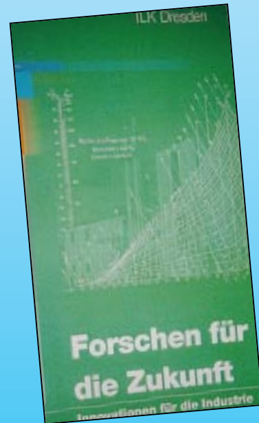
35 Jahre ILK in Dresden