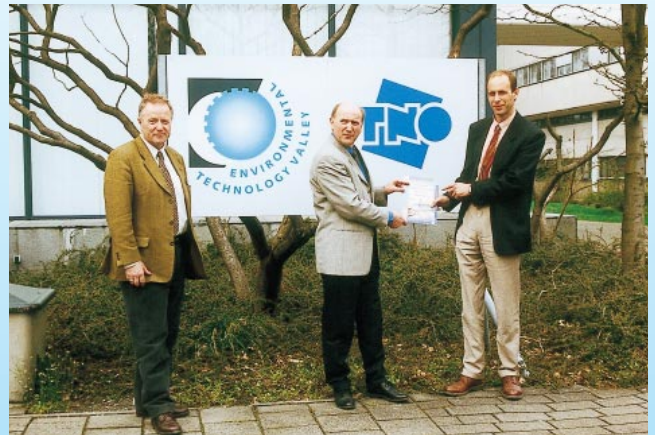
Ökologischer und ökonomischer Nutzen dank STIME©K