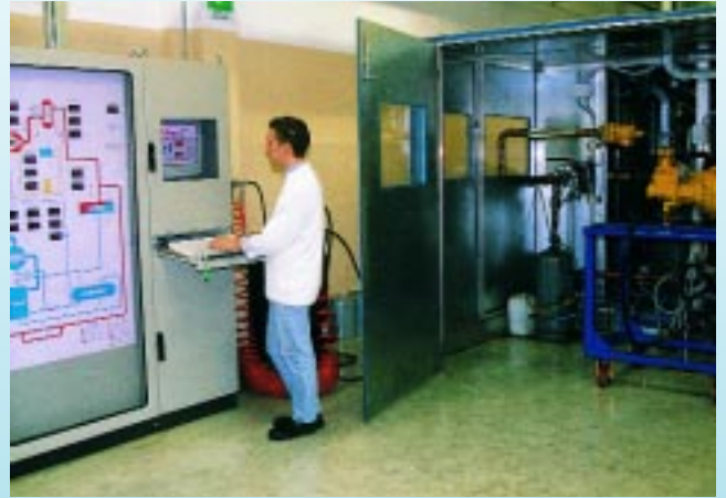
FRASCOLD und TEKO