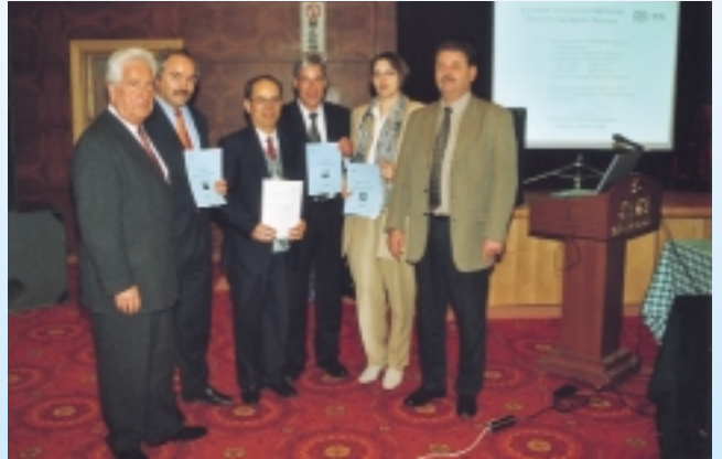
EN 378 jetzt chinesischer Branchenstandard