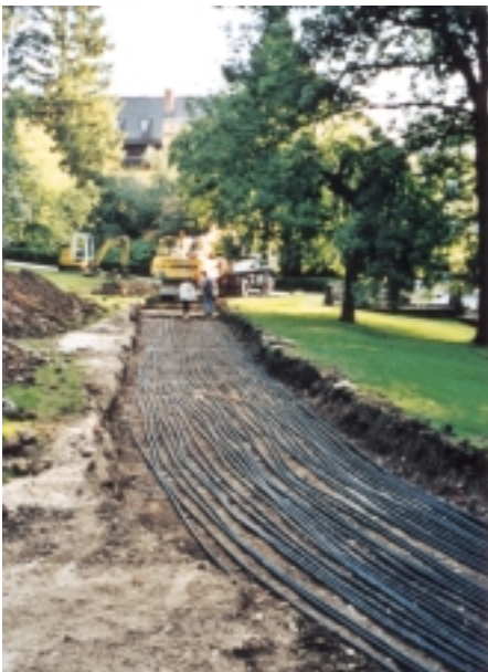
Der PE-Rohr-Erdkollektor in voller Länge und Größe

Der Clou jedoch wurde mit dem Verflüssiger gelandet. Wie eingangs angedeutet, erschien das Problem anfangs nur