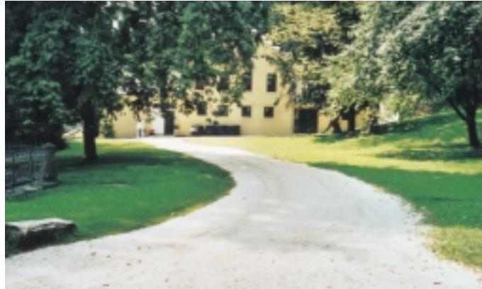
Die Zufahrt, unter der der Kollektor seinen Platz im Erdreich fand

sehr schwer lösbar, doch zeigte es sich dann als faszinierend einfach. Es wurde ein PE-Rohr Erdkollektor, mit 1700 m Rohrlänge, bestehend aus 3 \times 5 zu je 100 m 3/4 " PE-Rohr Kreisen, d. h. jeweils 5 Kreise pro Anlage, in die Zufahrt des Gebäudes gelegt (die einzige Fläche die aufgedrungen werden durfte).