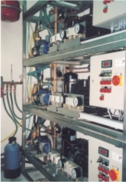
Die drei völlig identisch aufgebauten, aber getrennten Anlagen in einem Edelstahlkäfig

optimalen, aber je nach Aggregat verschiedenen Bedingungen. Die untere Anlage fährt bei 20 Hz! (die entspricht der minimal freigegebenen Frequenz), die mittlere bei 24 Hz und die obere bei 30 Hz. Jede der 3 Anlagen schaltet sich, gesteuert über eigene Raumtemperaturfühler, separat zu. Dadurch wird eine sehr gleichmäßige Temperaturverteilung im EDV-Raum erreicht.