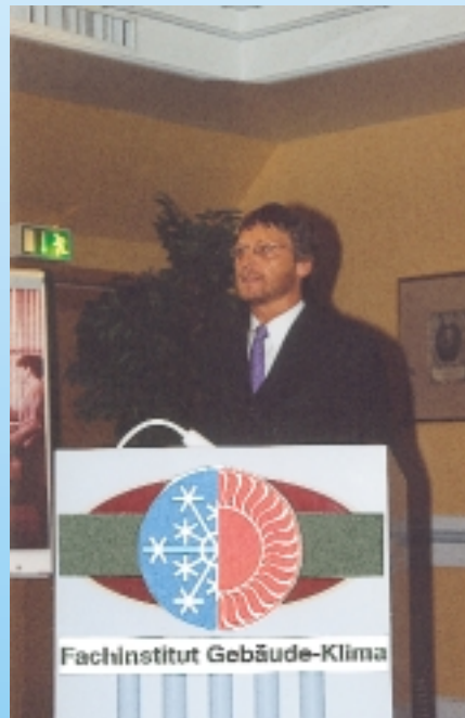
FGK: Es hat sich was bewegt