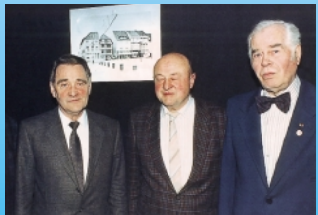
Zur Gründung des BIV: Die Zeit war reif