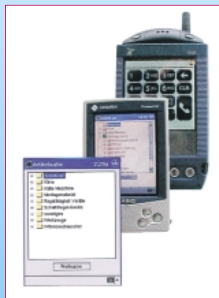
Mit dem Computer in der Tasche