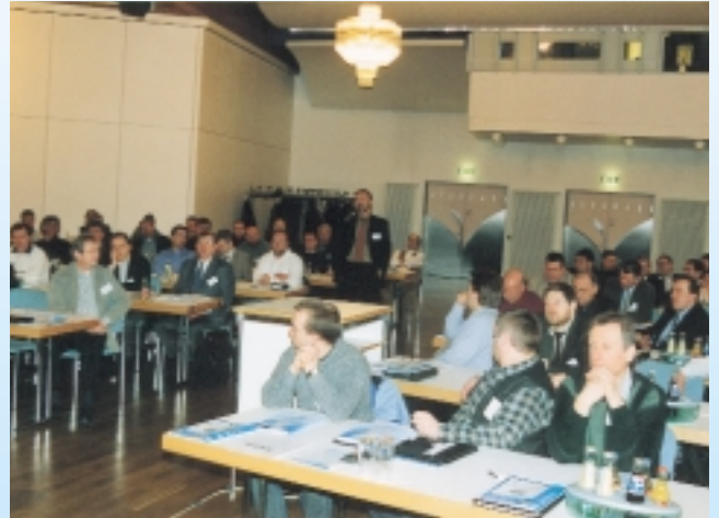
KK-Fachtagung: Information und Diskussion

Das Kälteanlagenbauerhandwerk . . . . . 76