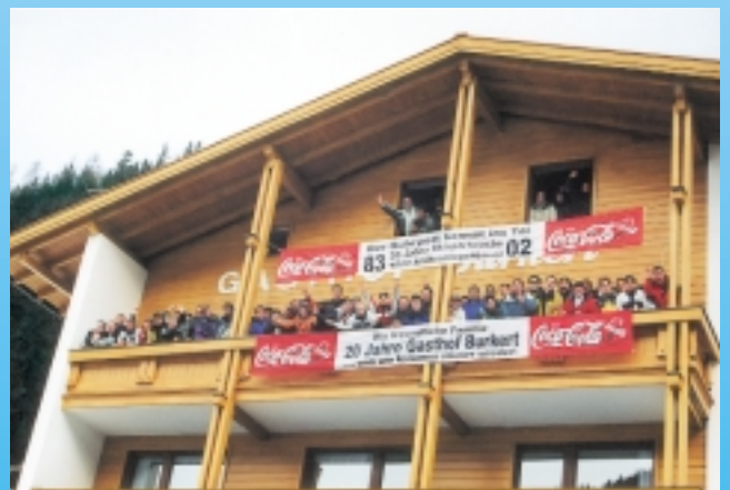
20 Jahre Skisportwoche NRW