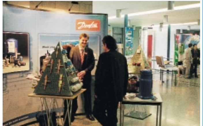
Während des Aktionstages waren auf der kleinen Ausstellung im HBZ-Foyer verschiedene Branchenfirmen mit Ansprechpartnern vor Ort

hen, das Kälteanlagenbauerhandwerk näher zu bringen, sowie auch die Leistungen dieses kleinen aber feinen Gewerks in der Öffentlichkeit darzustellen. Hierzu wurde in diesem Jahr zwischen dem 8. und 19. April im Foyer des HBZ eine kleine Ausstellung eingerichtet, die Branchenunternehmen die Darstellung ihres Angebotes ermöglichte. Und immerhin 22