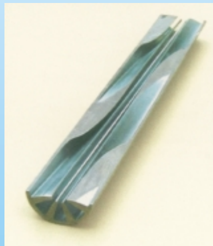
Hohe Effektivität durch Rippenrohre