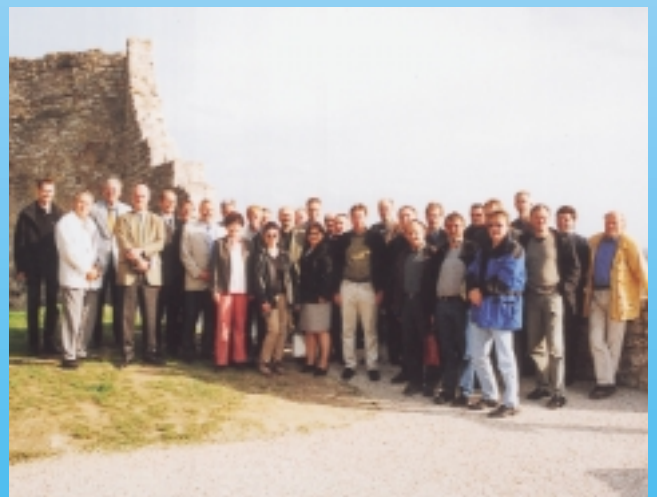
BIV-Lehrertreffen 2002: Kältelehrer goes Internet