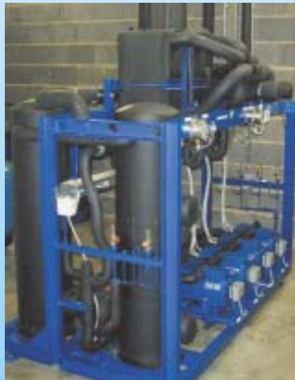
Supermarktkälteanlagen mit natürlichen Kältemitteln