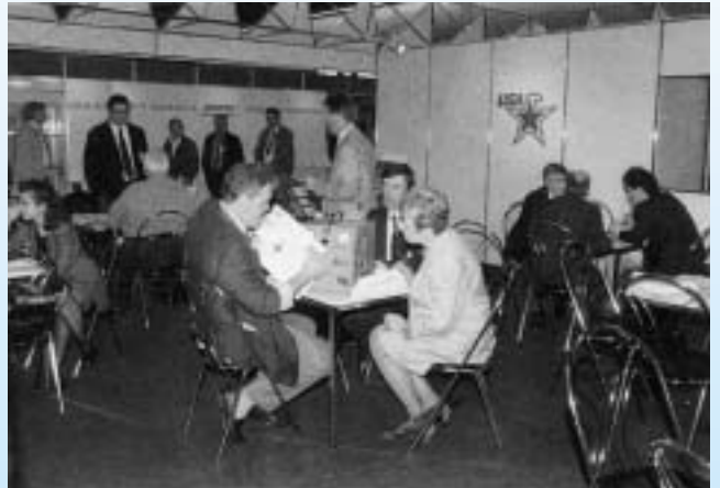
10 Jahre U.S.-Aussteller-Gemeinschaftsstand auf der IKK