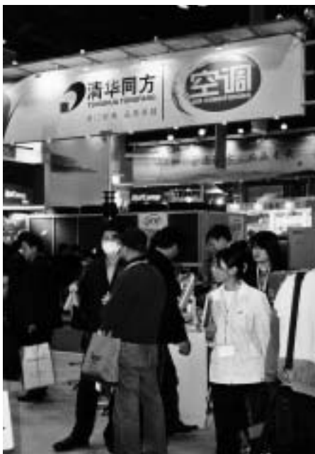
Dies war der einzige chinesische Kältefachmann, der mit Atemschutzmaske auf der China Refrigeration am 9. und 10. April anzutreffen war

Daß auch die chinesischen Kälte-techniker – vor allem, wenn Sie in Deutschland studiert haben – hoch begabt sind, wird am Beispiel von Tief-