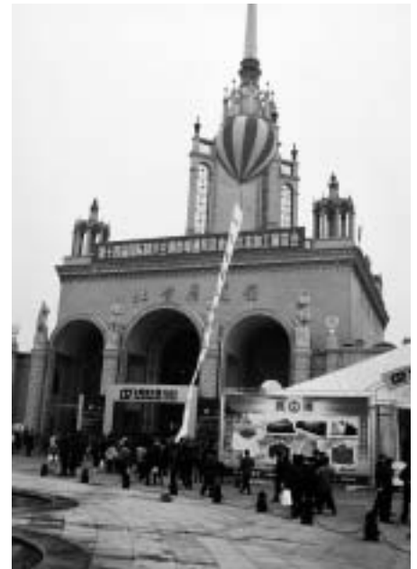
Einstmals von der Sowjetunion der Volksrepublik China als Kulturzentrum gestiftet, heute ist es Standort des Beijing Exhibition Center's, hier das Eingangsportale zur Halle 1

übrige Straßenbild der Großstadt Peking/Beijing blieb von dieser Vorsorge-Ausrüstung allerdings völlig unberührt, auch war auf dem dicht bevölkerten Messegelände der China Refrigeration 2003 nur ein einziger chinesischer Kälte-Klimafachmann mit Mund-/Atemschutz anzutreffen.