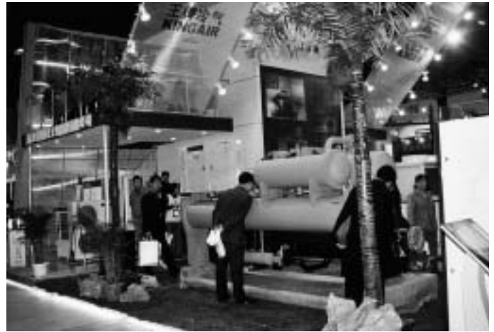
China wird immer selbstbewußter, das spiegelt sich auch auf den Ausstellungsständen wieder. Power durch die Bingshan Group, hier ein NH 3 -Schraubenverdichter-Flüssigkeitskühler, oder durch Kingair mit R 134a oder R 407C

Um jetzt zur eigentlichen Sache, dem Messereport zu kommen, ist wie schon im Jahr zuvor als zusammenfassender Eindruck wiederzugeben: Die Wirtschaft Chinas ist im ersten Quartal 2003 chinesischen Medienberichten zufolge um 9,9 Prozent gewachsen. Die Industrieproduktion sei um 17,1 Prozent gestiegen, heißt es darin weiter. China strebt für dieses Jahr ein Wachstum des Bruttoinlandsprodukts (BIP) von 7 Prozent an, nach 8 Prozent im Jahr 2002. Dies bewirkte auch einen rasanten Anstieg der Kälte-Klima-Produktionsmengen um ca. 15 % im vergangenen Jahr.