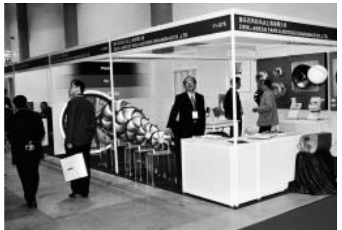
Nur ganz wenige deutsche und europäische Ausstellungsstände waren mit deutschen/europäischen „Langnasen“ besetzt. Das traf zum Beispiel zu auf Robotherm, Sauermann und Teledoor, im Gegenvergleich jedoch nicht auf Frascold, Güntner und Ziehl-Abegg