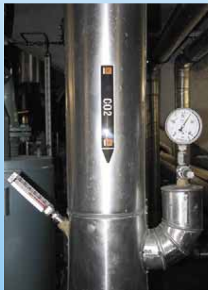
Die erste CO 2 - Kunsteisbahn Deutschlands