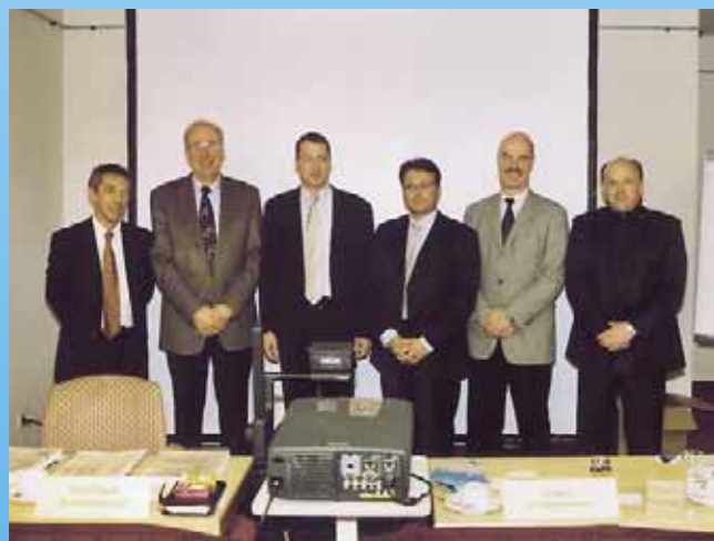
Der neue Vorstand beim Bundesinnungsverband des Deutschen Kälteanlagenbauer-Handwerks BIV