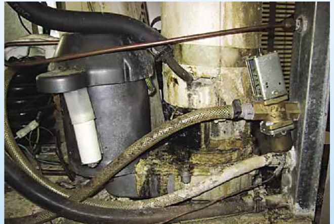
Warum denn in die Ferne schweifen, denn die Kohle liegt so nah!