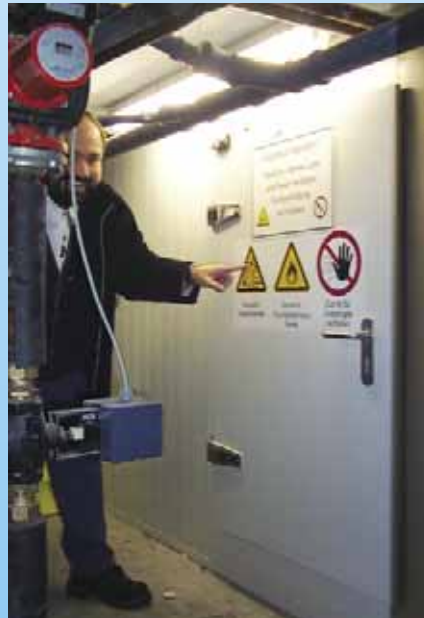
Energie- und umweltoptimale Propan-Sole- Kälteanlage für Bio-Supermarkt