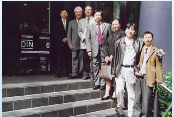
ASERCOM Performance Certification Program auch von Bedeutung für China