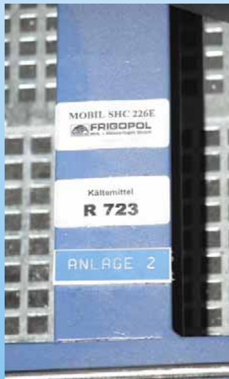
Österreichischer Energieversorger mit energie- optimierter Klima-Kälte