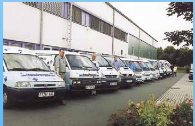
50 Jahre „Herr Klaus“ – Der Kälte & Klima-Profi in Bayreuth