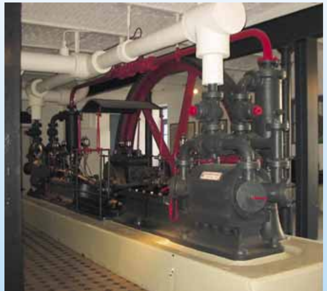
Seit 1881: Kühlung durch Wasserturbine dank Linde