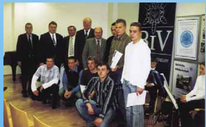
Bundesleistungswettbewerb Kälteanlagenbauer 2004