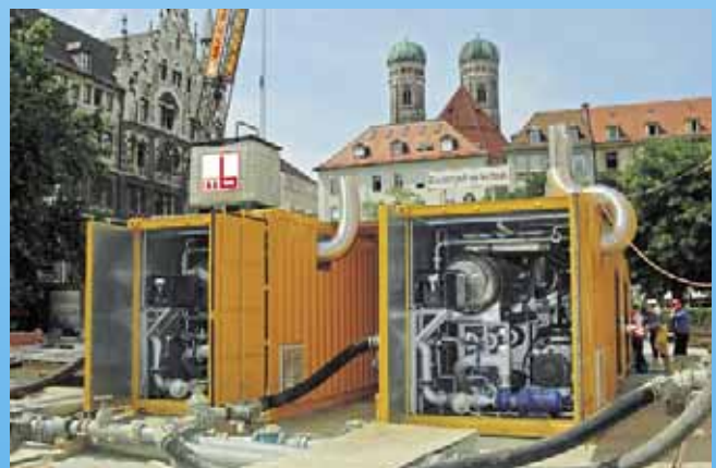
Moderner Tunnelbau nutzt Kältetechnik zur Baugrundvereisung