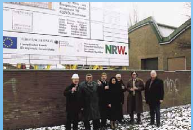
Baubeginnfeier am Aus- und Weiterbildungszentrum für Kälte-, Klima- und Energietechnik IKKE gGmbH