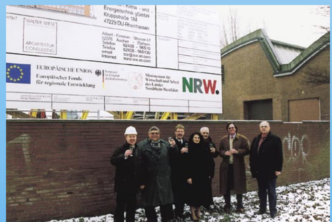
Baubeginnfeier am Aus- und Weiterbildungszentrum für Kälte-, Klima- und Energietechnik IKKE gGmbH