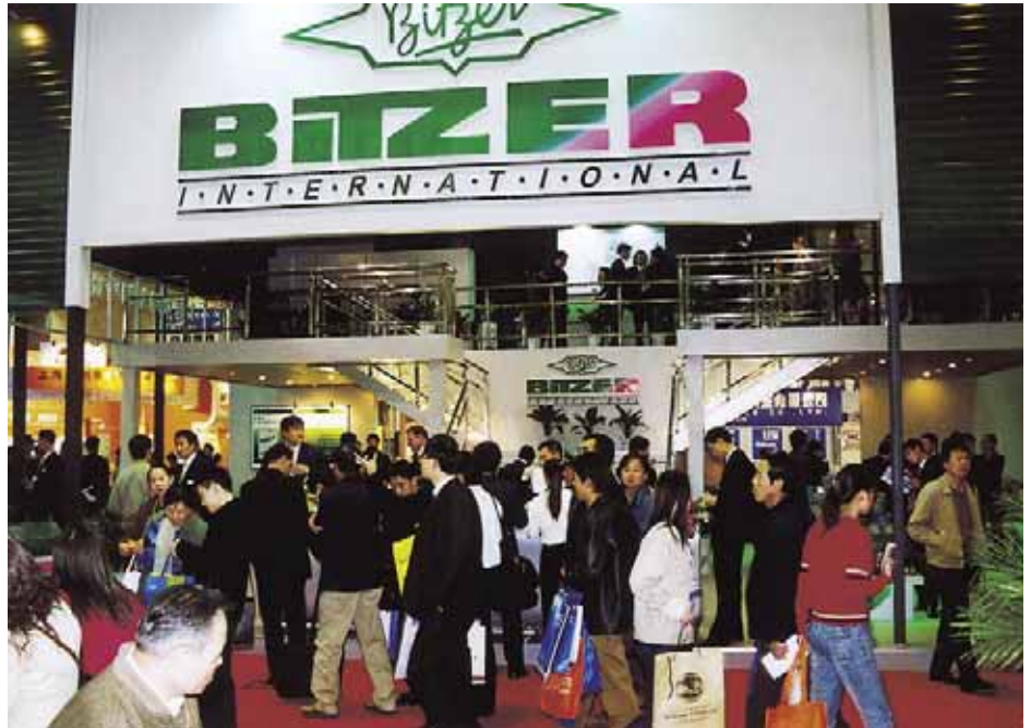
Schon am ersten Ausstellungstag besuchten etwa 15 000 Fachbesucher die Internationale Messe China Refrigeration auf dem Beijing Exhibition Center

Diese Probleme wird es 2006 nicht geben, denn die 17 th International Exhibition China Refrigeration findet dann vom 11. bis 13. April auf dem Shanghai New International Expo Center in Shanghai Pudong statt. Dort werden dann rund 57 500 m 2 Ausstellungsfläche für mehr als 600 internationale Aussteller zur Verfügung stehen und es werden ähnlich wie 2004 mehr als 46 000 internationale Fachbesucher die China Refrigeration in Shanghai besuchen. ■