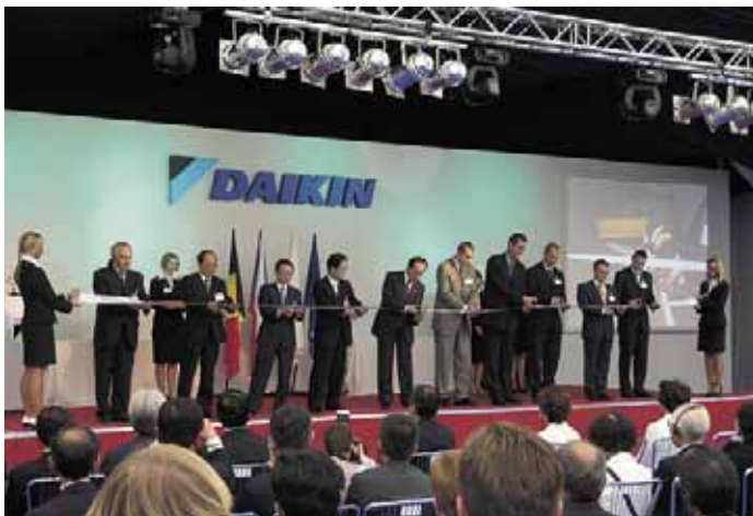
Feierliche Eröffnung des neuen DAIKIN-Werkes in Tschechien