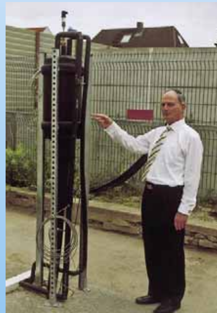
Erdwärmerohr mit CO 2 als Transportfluid