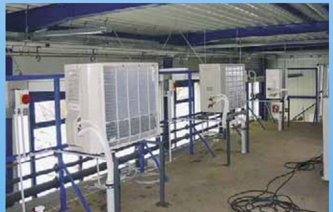
Ausbildung an modernen Split-Klimageräten