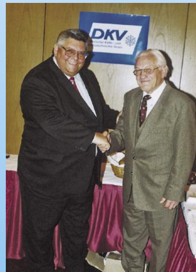
Deutsche Kälte-Klima-Tagung 2005