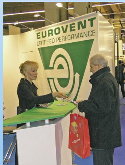
Die Interclima + Elec in Paris