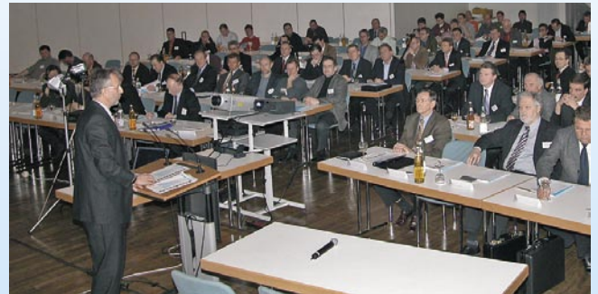
5. KK-Fachtagung topp-aktuell