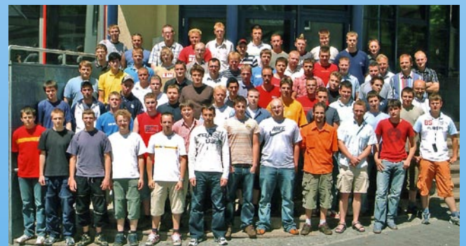
Gesellenfreisprechung in Sachsen 2006