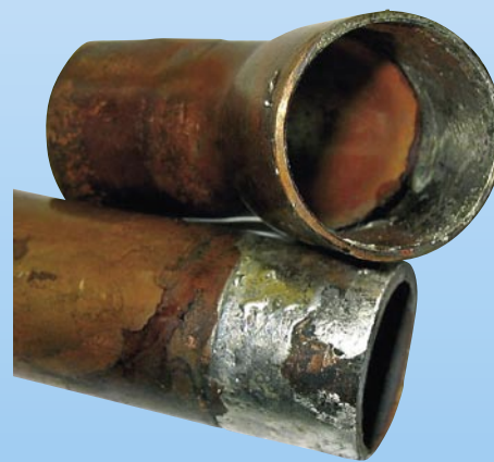
Lötfehler im Technologie- unterricht