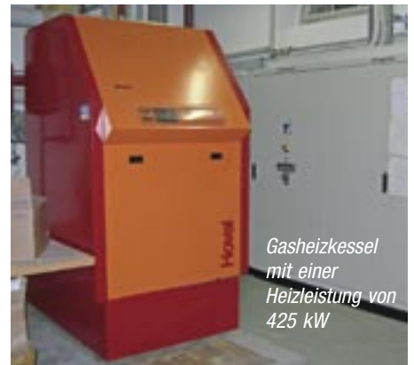
Gasheizkessel mit einer Heizleistung von 425 kW