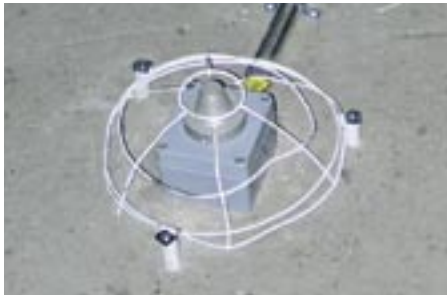
Gasdetektor auf dem Fußboden mit Berührungsschutz

Explosionen benötigen neben einem explosiven Gas/Luftgemisch auch eine Zündquelle wie z. B.: