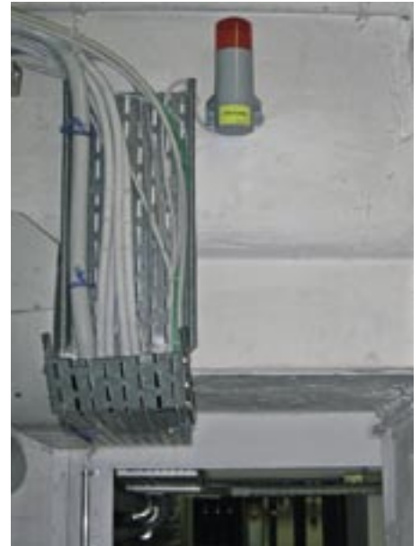
Warnleuchte über der Eingangstür zur Heizzentrale

Mit brennbaren Kältemitteln ist Abwägen des Risikos und die Einhaltung der Sicherheit ein absolutes Muss. Es ist deshalb unbedingt notwendig, die maßgeblichen Normen und Vorschriften einzuhalten sowie die notwendigen Bewilligungen einzuholen.