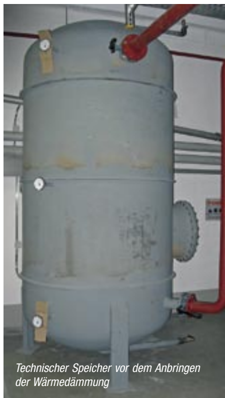
Technischer Speicher vor dem Anbringen der Wärmedämmung