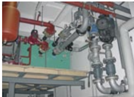
Anschlüsse der Kalt- und Heizwasserleitungen sowie der Zylinderkopfkühlung seitlich am Monoblock