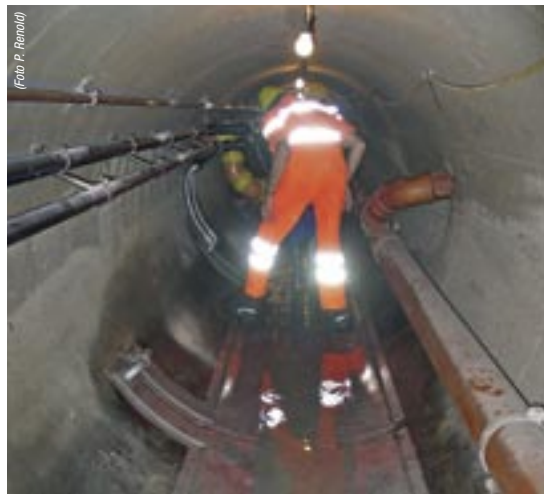
Wärmetauscher im Abwasserrohr eingebaut