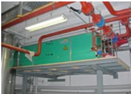
Monoblockgerät mit der eingebauten Wärmepumpe. Gut sichtbar die Revisionstüranordnung zur Bildung einer Wanne

tur selten unter +10 °C und ist somit auch während der Heizperiode ein idealer Energieträger. Dabei ist anzumerken, dass bei einer Wassertemperatur unter 8 °C die Wärmepumpe stillgelegt werden muss. Messungen zeigten aber, dass auch im Winter die Wasserzulauftemperatur nicht unter +13 °C gesunken ist. Der Kanal führt die Abwässer aus drei Stadtkreisen dem Klärwerk Werdhölzli zu und weist ganzjährig eine genügende Wassermenge von durchschnittlich 1400 m 3 /h auf. Bei starken Sommergewittern und bei der Schneeschmelze steigt die Abflussmenge kurzzeitig stark an. Mit der Abwärmeenergie kann 85% der benötigten Wärmemenge des Schulhauses inkl. Warmwasser erbracht werden.