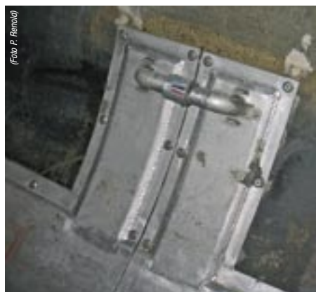
Verbindung zur Serienschaltung der Wärmetauscherschalen