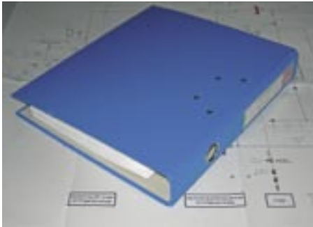
Ordner mit den Zertifizierungsunterlagen PED und ATEX für die Propanwärmepumpe