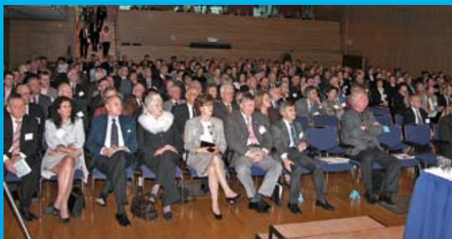
DKV in der Stadt der Wissenschaft