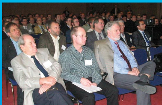
Deutsche Kälte-Klima-Tagung 2006