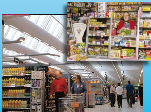
„Supermarkt“ mit reduziertem Energiebedarf