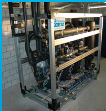
Transkritisch tiefkühlen mit CO 2 bei CC GROWA