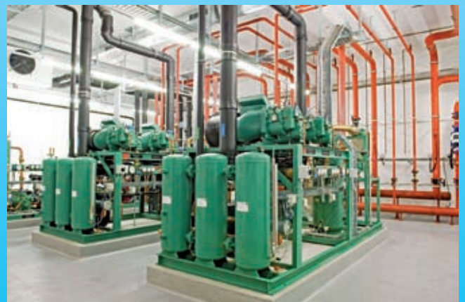
Romer's Hausbäckerei: Qualität mit Tradition