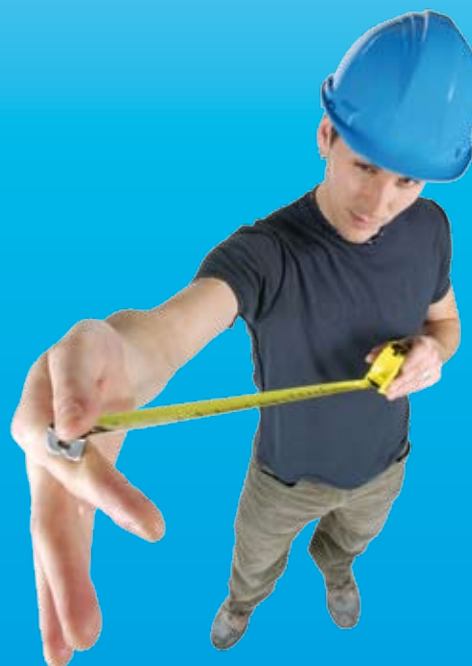
Personalentwicklung – ein wenig beachtetes Branchenthema