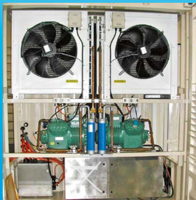
Kältetechnik auch in Wind-Dieselmotoren unersetzlich